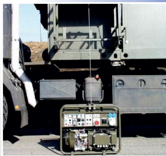
EC vyjmuta a spuštěna na terén